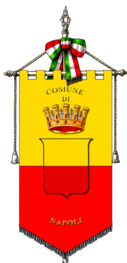
Bandiera di Napoli